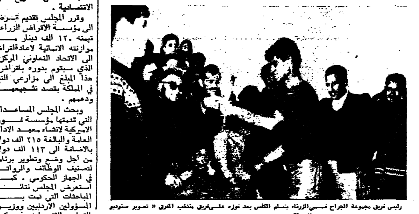
رئيس فريق مجموعة الجراح في الزرقاء يسلم الكفاس بعد نوره على فريق منتخب العراق

مجلس الاعمار يجت مساعديت فورد ومكتب الحكومة الاميركية